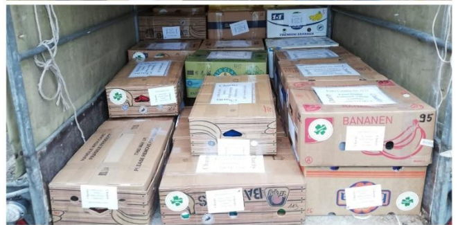
Am Freitag wurde der Anhänger von uns beladen