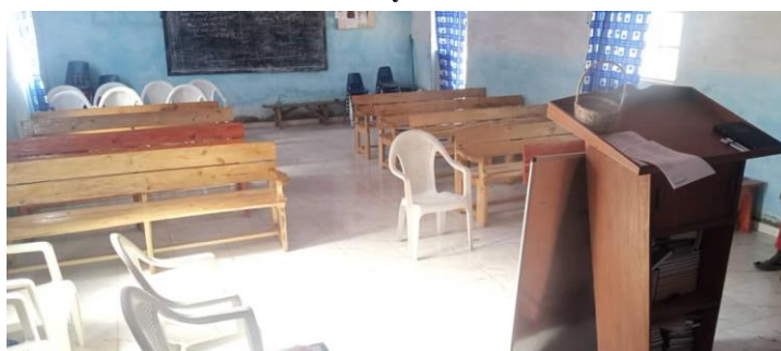
Die in unserem Ausbildungszentrum hergestellten Kirchenbänke stehen jetzt in der christlichen Kirche in Kubuneh