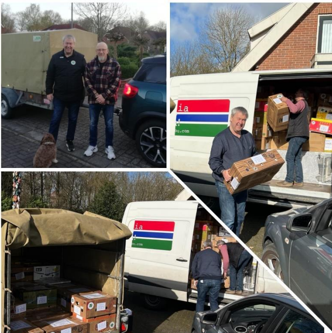
Umladen der Kartons in das Fahrzeug von „Gambia for you“