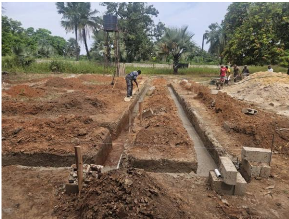
Nachdem ausreichend Steine gefertigt worden waren, wurde mit den Fundamenten begonnen

Wir können stolz, glücklich und dankbar auf diesen Meilenstein blicken – und ihn gemeinsam feiern! Allen, die dazu beigetragen haben, recht herzlichen Dank!