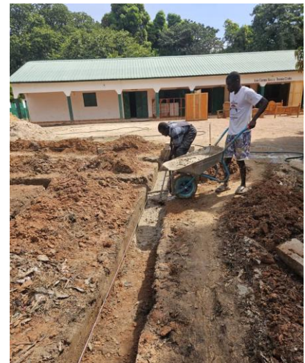
Inzwischen sind sogar schon erste Steine gesetzt. Es ging zügig voran