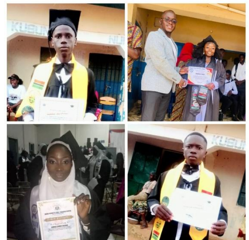
Mehrere unserer Patenkinder beendeten die 9. Klasse in Kubuneh und gehen jetzt zu einer weiterführenden Schule in der Umgebung

In den vergangenen Monaten war das Patenschaftsprogramm von umfangreichem organisatorischem Aufwand geprägt. Sowohl auf der Seite der Sponsoren als auch auf der Seite der Patenkinder gab es einige Wechsel zu organisieren. So schlossen z.B. am Schuljahresende mehrere Kinder ihre Schulbildung ab oder verließen den Ort Kubuneh, sodass geklärt werden musste, wie ihre Förderung künftig gestaltet werden kann und ob sie weiterhin im Programm bleiben. Aber auch positive Entwicklungen prägten die vergangenen Wochen: Neue Sponsoren meldeten sich, und für jedes neu aufgenommene Kind wurde ein individuelles Datenblatt angelegt. Sowohl vor Ort in Kubuneh als auch hier werden fortlaufend aktualisierte Listen geführt, um einen genauen Überblick zu behalten. Derzeit sind 136 Kinder erfolgreich vermittelt. Weitere 14 Kinder stehen auf der Warteliste und warten auf eine Patenschaft.