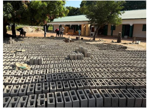
Die ersten Steine sind geformt und müssen jetzt in der heißen Sonne trocknen